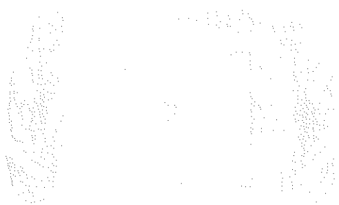
JUSSARA MENICUCCI DE OLIVEIRA Prefeita Municipal

Prefeitura Municipal de Lavras, em 09 de setembro de 1.994.